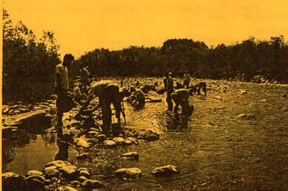
Cercatori italo-francesi lungo le rive dell'Elvo, durante la visita descritta nell'articolo.